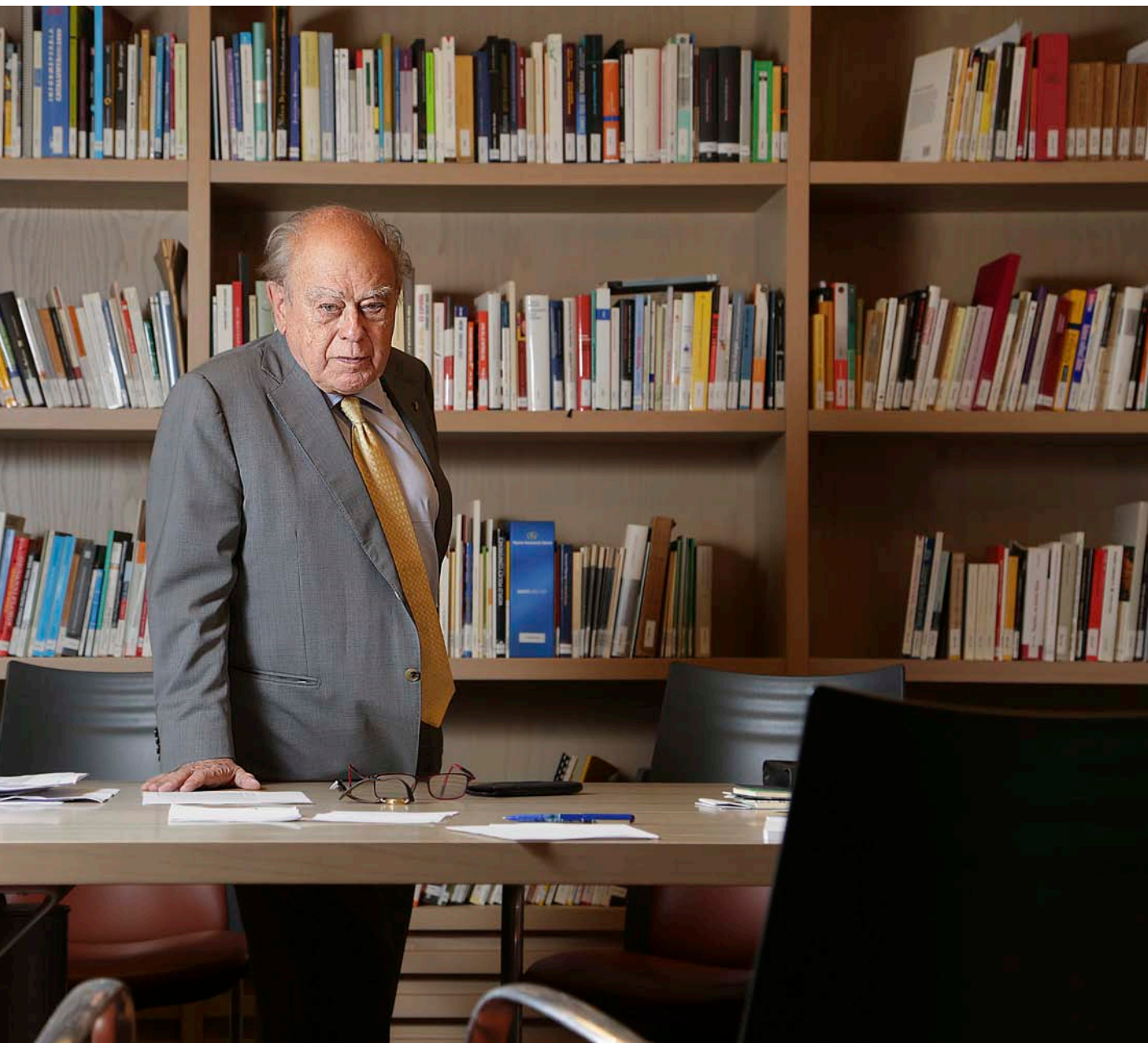
una de les prerrogatives a què ha renunciat després de la confessió, entre les quals hi ha, a més, el sou d'ex-president.

El diumenge 13 de juliol devia ser la data en què l'ex-president Pujol es va confessar a Mas, que va quedar "colpit" per les revelacions, i això devia precipitar la resta d'esdeveniments.