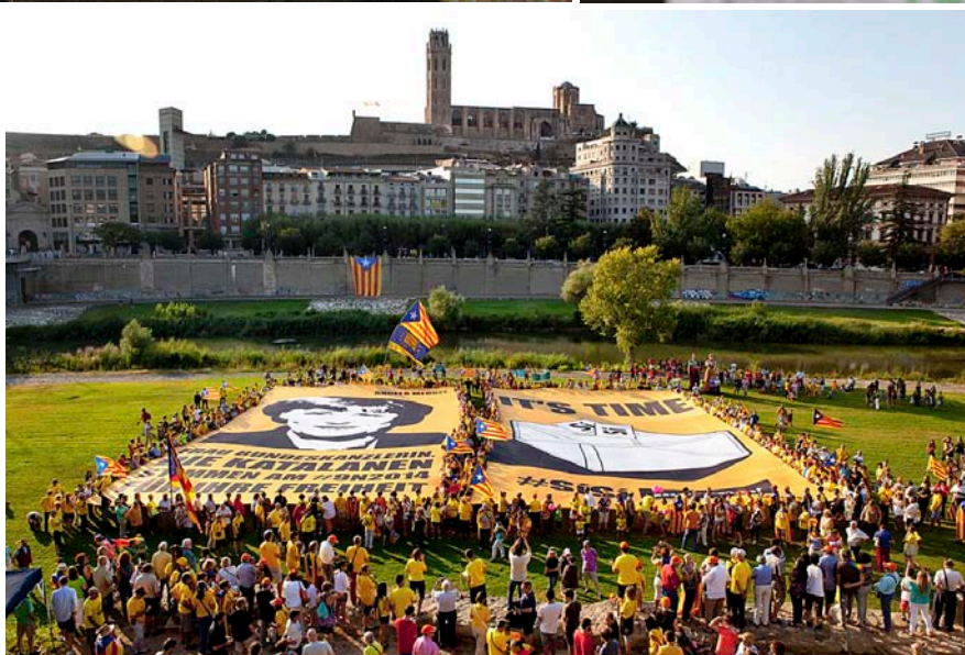
A dalt, Artur Mas a l'arribada a l'Executiva Nacional de CDC el 14 de juliol. A la dreta, Josep Antoni Duran i Lleida al Congrés dels Diputats el 8 d'abril defensant la transferència de la convocatòria de referèndums. A sota, acte de l'ANC a Lleida, la setmana passada.

el sector independentista del partit, que, tot i haver crescut, ara mateix ningú no s'atreveix a quantificar. Si la conseqüència fos una esquerra prou ampla, dependria de la profunditat de les dimensions d'un estrat i de l'altre en el moment en què el partit fes el seu congrés.