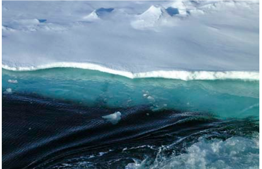
La vida és possible en espesses capes de gel d'estels del nostre sistema solar tant com en els d'estels molt més llunyans.

Actualment se sap que temps enrere l'aigua discorria per Mart. Per aquesta raó, es pot pensar que també podria haver-hi hagut vida. També és fins i tot possible que sota la superfície terrestre de Mart, on potser