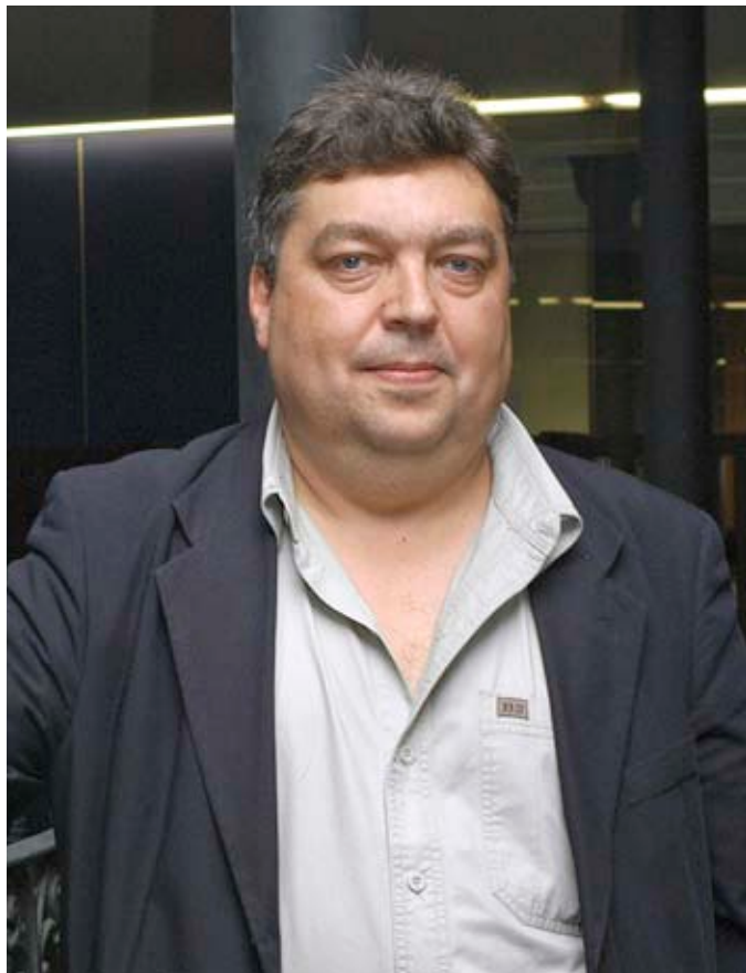
PRATS I CAMPS