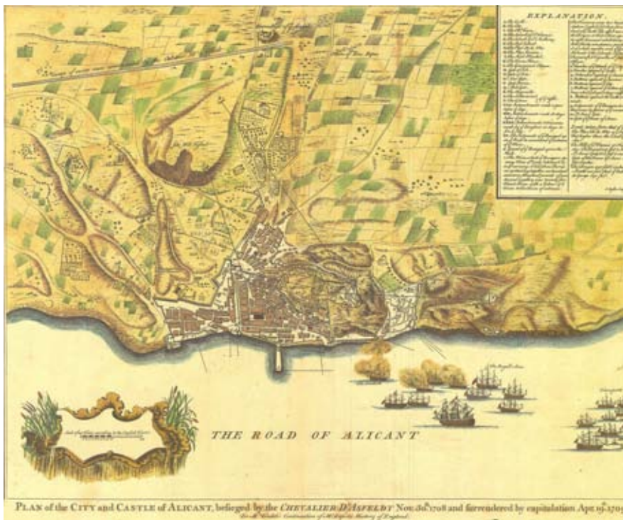
Plànol de la ciutat d'Alacant del 1708, amb la nomenclatura dels carrers en llengua anglesa, una de les conseqüències de la presència austriacista.

E l fum del bombardeig perpetrat pels francesos a Alacant encara durava. Encara era ben perceptible el rastre d'aquella ofensiva descomunal, que pràcticament havia destruït la ciutat l'any 1691 i que seria l'avantsala cruenta del que havia de venir més endavant, amb motiu de la guerra de Successió.