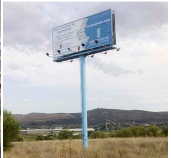
L'A7, al seu pas per l'Alcoià, no va inaugurar-se fins el 2011, i el nou col·legi El Bracal –a Muro– i el nou hospital d'Ontinyent només són uns plànols.