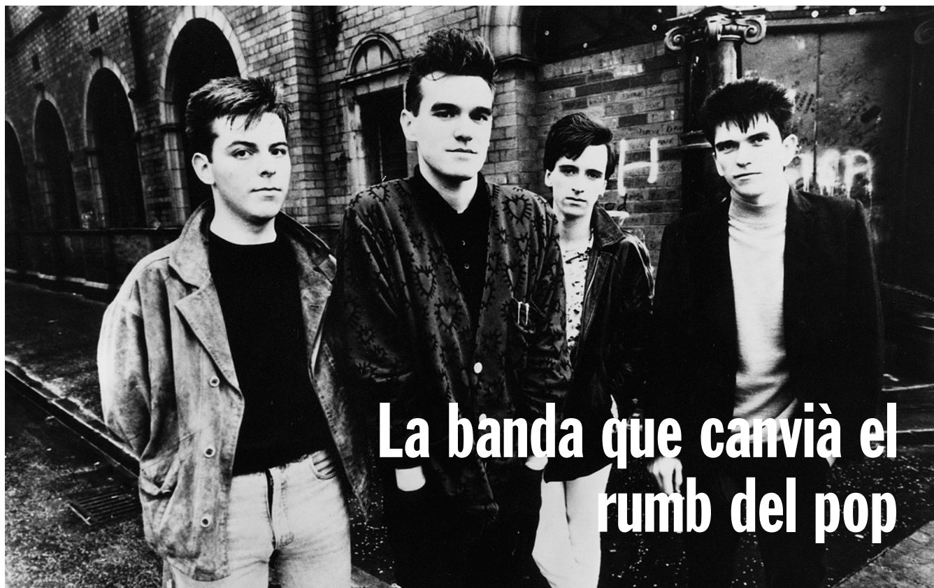
De dreta a esquerra, Andy Rourke, Morrissey, Johnny Marr i Mike Joyce

La digestió social i musical del 'punk' als anys 80 derivà en una producció bastant banal i superficial. Fins que una banda de Manchester, The Smiths, irrompé el 1984, ara fa 30 anys, amb un disc de títol homònim. La volcànica personalitat de Morrissey, el frontman del grup, i el talent musical del guitarrista Johnny Marr, sacsejaren un anodí panorama musical.