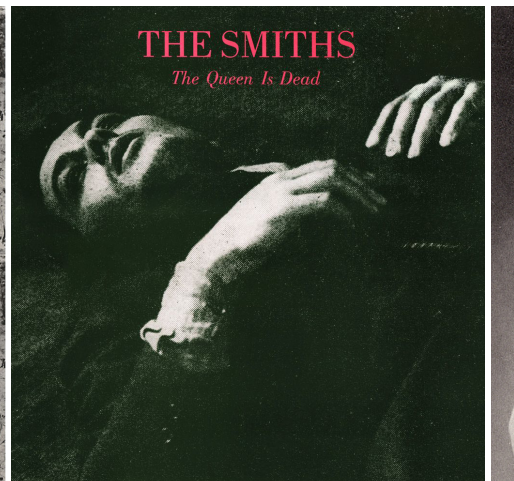
Portades de Meat is murder i The Queen is dead , els dos àlbums referencials de la banda. A la

de seguidors en els seus concerts en directe, cosa que els portaria aviat de Manchester a Londres per dimensionar definitivament la seva trajectòria musical i convertir-se en uns dels abanderats del rock alternatiu.