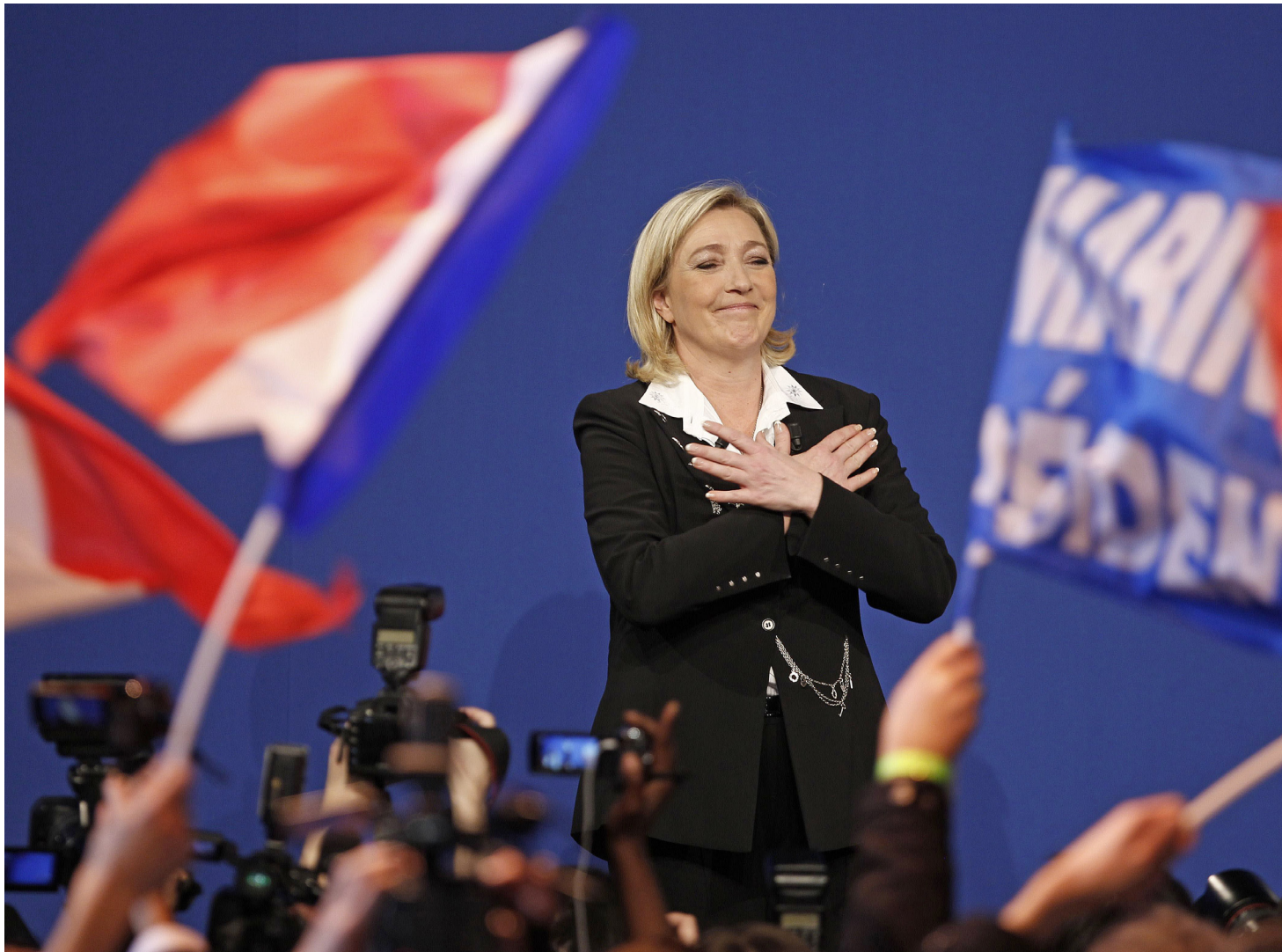
“Volem representar a tots els francesos amb idees que no són ni d’esquerra ni de dreta”. A la dreta, dalt, Bernd Lucke, d’Alternativa per a Alemanya

da que la francesa. Tot i així, no hi ha un partit com el vostre.