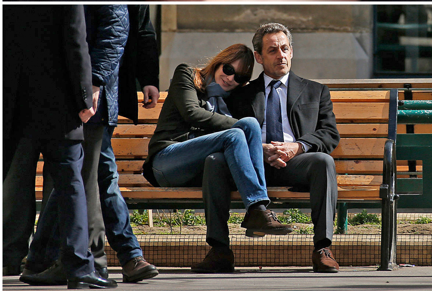
Per a Marine Le Pen (en la foto de dalt), Nicolas Sarkozy (en la foto, amb Carla Bruni), ja està acabat com a candidat.

—D'alguna manera, sí. Abans érem un dels països més rics del món i ara anem cap a una recessió. L'austeritat que se li ha imposat a la ciutadania no