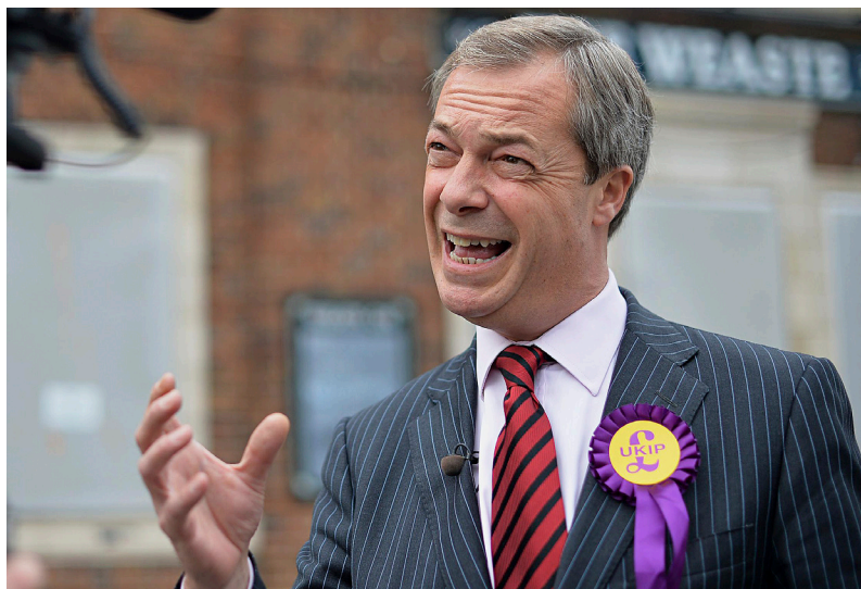
i baix, Nigel Farage, d'UKIP.

potencials entre abstencionistes com entre votants. Com ja he dit, estic molt convençuda que arribarem al poder en aquesta dècada vinent. Fins i tot abans del que alguns s'imaginien.