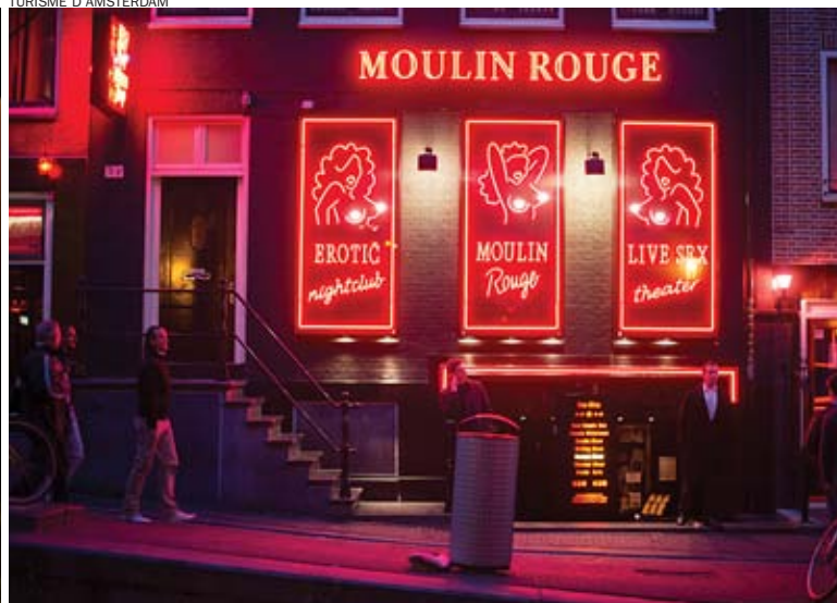
El PIB dels Estats europeus estimarà l'aportació econòmica de la prostitució, el consum i tràfic de drogues i la inversió en R+D a partir del 2016.

Europees són conscients que aquesta metodologia serveix només per fer una aproximació, que en cap cas serà un mirall fidel de la realitat, i de fet, l'objectiu és un altre: "Millorar i harmonitzar la metodologia de càlcul d'aquestes activitats en tots els Estats membre", perquè ara com ara, els Estats que han incorporat aquestes activitats al PIB ho han fet amb criteris massa diferents.