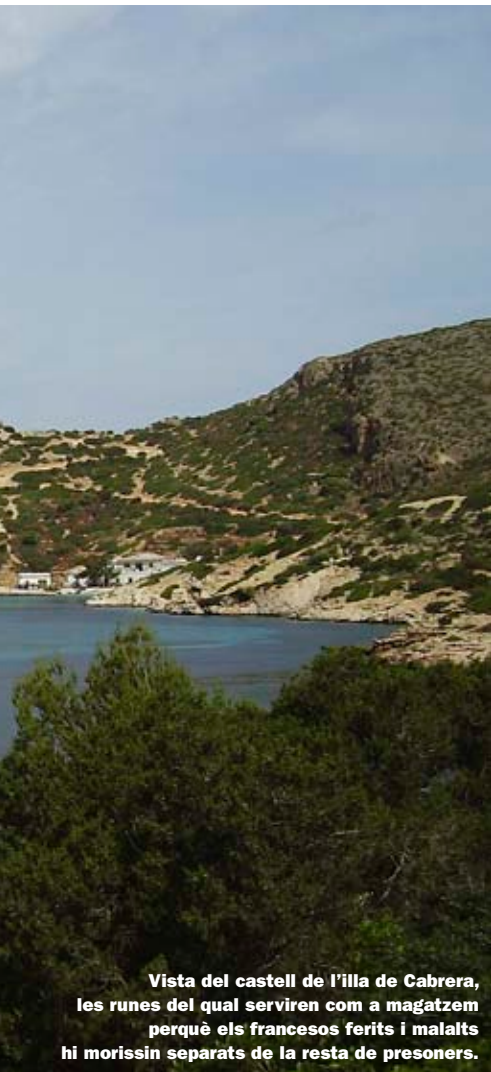
Vista del castell de l'illa de Cabrera, les runes del qual serviren com a magatzem perquè els francesos ferits i malalts hi morissin separats de la resta de presoners.