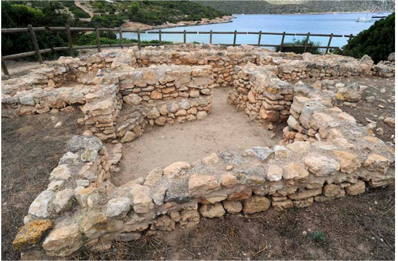
Entre 1809 i 1814 fins a 12.000 presoners francesos foren confinats a Cabrera, dels quals només en sobrevisqueren uns 3.000.

el pànic s'apoderava de tothom. I els més dèbils sabien que els havia arribat l'hora. Un context tan terrible provocà l'aparició de casos de canibalisme amb els cadàvers dels companys. I també de coprofàgia. Valia tot per sobreviure. O per intentar-ho.