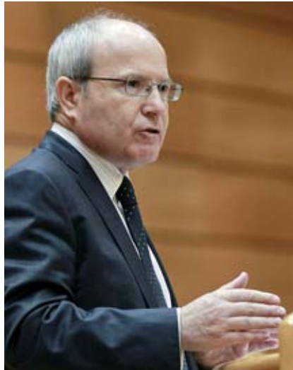
En un any com a primer secretari, Navarro va obtenir 50.000 vots menys que Montilla.

Hi ha cap possibilitat que aquest moviment acabi confluint amb el PSC? “Jo no dic que, més endavant, a la llarga i a mesura que anem fent coses, pugui