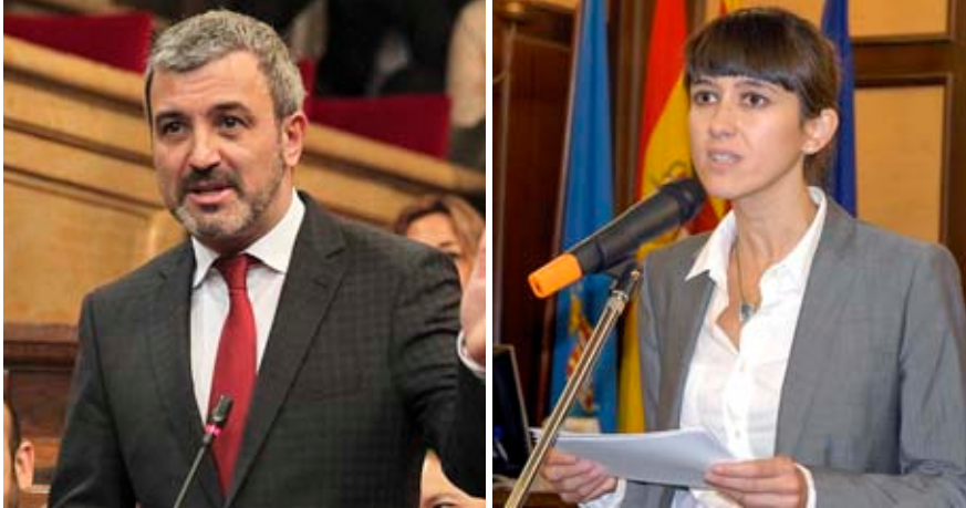
Jaume Collboni ha negat que vulgui presentar-se a primer secretari del PSC. Núria Parlón, en canvi, sembla l'opció preferida pels continuistes de l'executiva del partit.

permetia no sortir mai del bloc del catalanisme polític i la gent ha vist que, des dels acords de Granada, hem canviat de manera clara i hem anat sortint a poc a poc d'aquest bloc. La tercera cosa que no hem fet bé, potser la més important, és que formem part d'un partit nascut a la Transició que sumava moltes coses i era útil a la gent. Ara, en canvi, ens han vist al Govern i ens identifiquen amb 'la casta', que hem tingut molt a veure