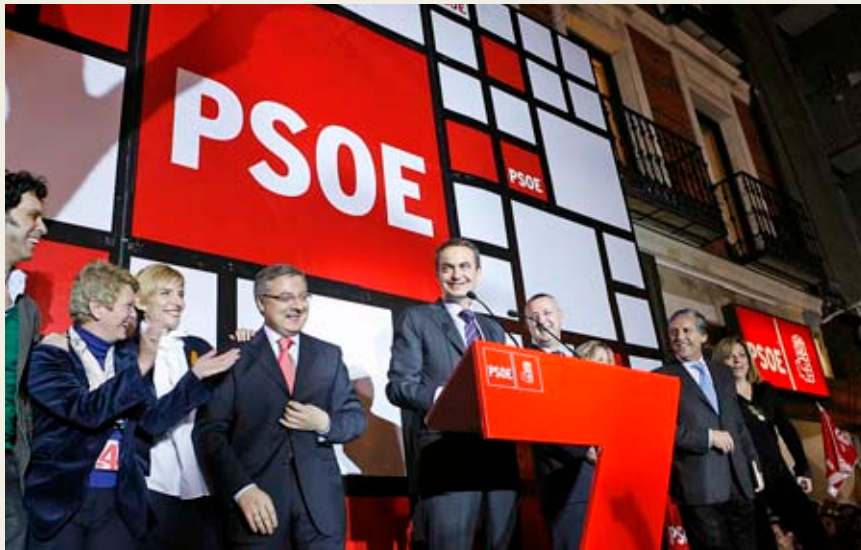
Rodríguez Zapatero ha estat el líder estatal que ha arrossegat més vots al PSC. Tant el 2004 com el 2008 va superar amb escreix el milió i mig de sufragis a Catalunya

La decadència dels resultats electorals del PSC, a Catalunya, comença després de 2003, quan Pasqual Maragall aconsegueix formar Govern amb ERC i Iniciativa –el primer tripartit–, tot i haver quedat segon en nombre de diputats (42). Ironies de la història: aquella nit Maragall havia aconseguit el segon millor resultat de la trajectòria del PSC al Parlament, però estava enfonsat perquè la seva victòria no havia estat prou clara per poder-li passar la mà per la cara al seu rival, Artur Mas –per segona vegada consecutiva CiU aconseguia més escons que el PSC amb menys vots que els socialistes. Diuen que va ser Montilla qui el va animar i li va fer veure que el PSC, amb ERC i Iniciativa podien sumar i fer fora CiU de la Generalitat. El mateix Montilla faria, posteriorment, un segon tripartit tot i haver aconseguit uns resultats força inferiors (235.000 vots menys), marcant ja clarament el camí de baixada. La segona vegada que Montilla es presentaria com a candidat a la presidència, els resultats van ser, aquest cop sí, molt preocupants: els pitjors en quinze anys per al PSC, en números absoluts i en