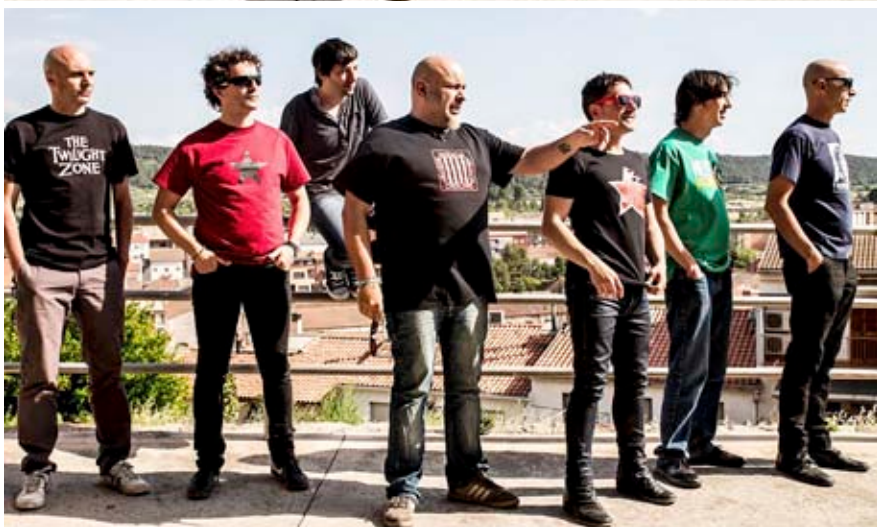
Dotze discos després, Brams tenen molt clar el full de ruta. El grup al complet, en una triple imatge promocional.