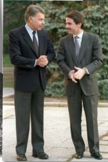
Des de la represa democràtica, el PSOE i la força hegemònica del centre-dreta –primer la UCD i ara el PP– havien copat la política espanyola. D'esquerra a dreta, Felipe González i Adolfo Suárez; González