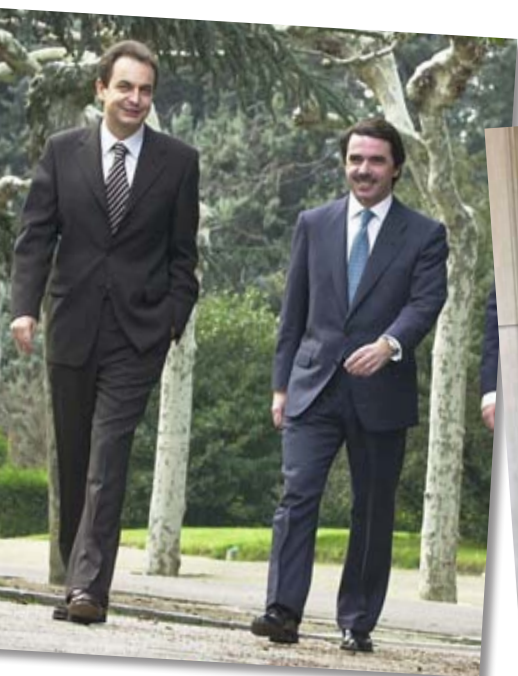
i José María Aznar; Aznar i José Luis Rodríguez Zapatero, i Zapatero i Mariano Rajoy.