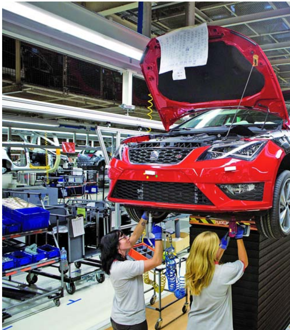
La productivitat a l'Estat espanyol té un comportament anticíclic: incrementa en temps de crisi i

La teoria econòmica diu que en temps de crisi cau la productivitat, i augmenta amb les vaques grasses. A l'Estat espanyol, però, és a l'inrevés: a més crisi, més productivitat. La raó? Una classe empresarial acostumada a confondre l'eficiència amb el bon resultat dels contactes polítics i una legislació pensada per vincular la productivitat a la por de perdre el lloc de treball.