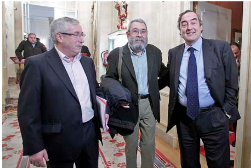
L'executiu de Mariano Rajoy es va reunir amb representants dels sindicats espanyols i la patronal CEOE per parlar de la reforma laboral i cercar un acord social, que finalment no es va produir.