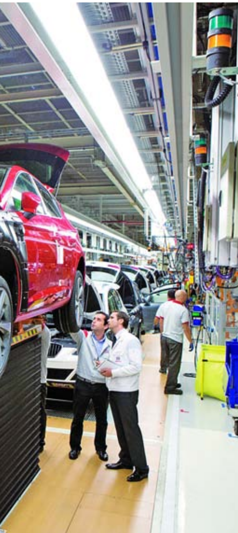
cau quan el cicle econòmic és positiu.

productivitat va quedar pràcticament estancada, amb creixements d’entre el 0% i el 0,3% anual, mentre que entre el 2008 i el 2013, aquest índex ha crescut a un ritme d’entre el 3% i el 3,5%. A què respon aquest comportament anticíclic que trenca els esquemes de qualsevol economia avançada? El professor de Teoria Econòmica de la UB Josep González ho atribueix al fet que “durant el franquisme, i es manté fins als nostres dies, davant d’una crisi l’empresari opta per suprimir la mà d’obra supèrflua, i els treballadors que continuen són coaccionats per treballar més i cobrar menys. I si protesten, saben que poden anar al carrer, més ara que la reforma laboral ha fet el mercat de treball encara més flexible”. Aquest context aboca l’economia espanyo-