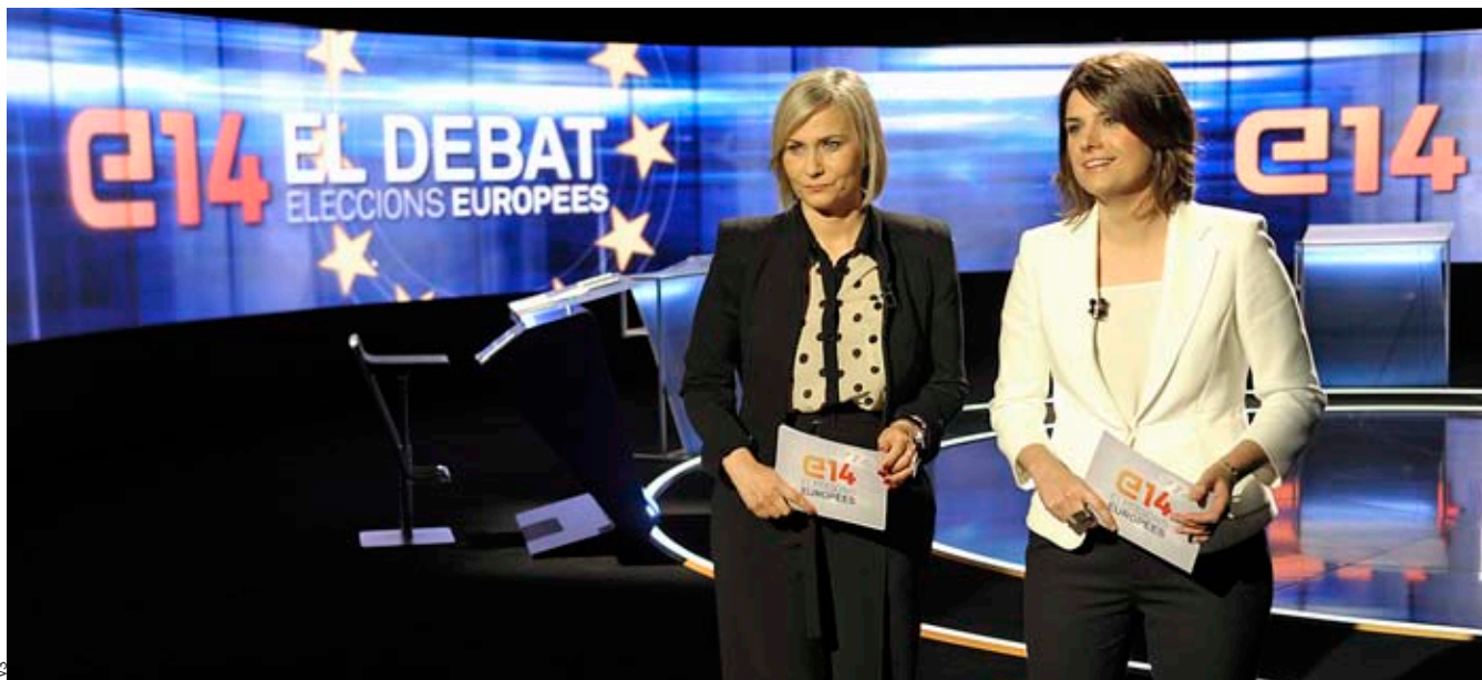
El percentatge de català a la televisió ha baixat amb la televisió digital en comparació de l'època analògica.

gràfic— però Indústria ha decidit treure a totes les comunitats autònomes de l'Estat un múltiplex i argumenta que Catalunya encara surt guanyant perquè Catalunya en té tres i la resta en tenen només dos.