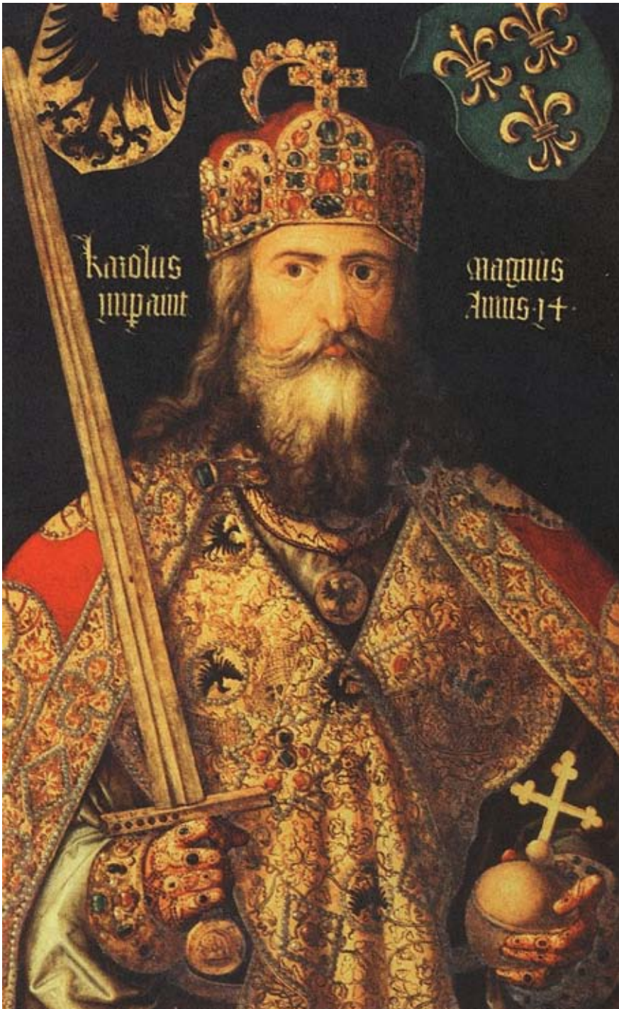
Amb el cristianisme com a element unificador cultural i religiós, a més de la capacitat militar, Carles el Gran unificà Europa occidental entre els segles VIII i IX. Aci, pintat per Dürer segles més tard.

El segon fill del rei franc Pipí el Breu va ser batejat amb el nom de Carles. Se suposa que va néixer el 2 d'abril de 742. Així ho diuen la majoria de fonts. Però la veritat és que ningú no n'està del tot segur. Podria haver nascut l'any referit, però també el 746 i fins i tot el 748. Les incògnites s'amplien al lloc de naixement. Habitualment se l'ha situat a la ciutat natal de son pare, Herstal, tot i que podria haver arribat al món a Lieja, Jupille, Ingelheim, Prüm, Düren, Gauting o Aquisgrà, les tres primeres enclavades en el territori que avui dia coneixem com a Bèlgica i la resta al país que anomenem Alemanya.