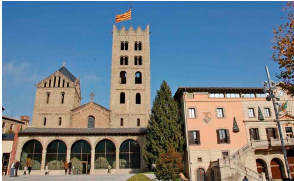
Al monestir de Ripoll hi ha enterrades les despulles de Guifré el Pilós, qui a finals del segle IX unificà el bessó del que seria Catalunya. A la dreta, Aquisgrà, on va morir Carlemany el 814.

Dos anys més tard controlava totalment el nord italià i cap al 778 finalitzà l'annexió de la major part del Benevent, la zona meridional de la península. Aquell mateix any inicià la guerra contra els moros a l'antiga Hispània. Malgrat la derrota amb els vascons a Roncesvalls –en la qual la morí el seu nebot Rotllà, un fet que el segle XI donà lloc al molt