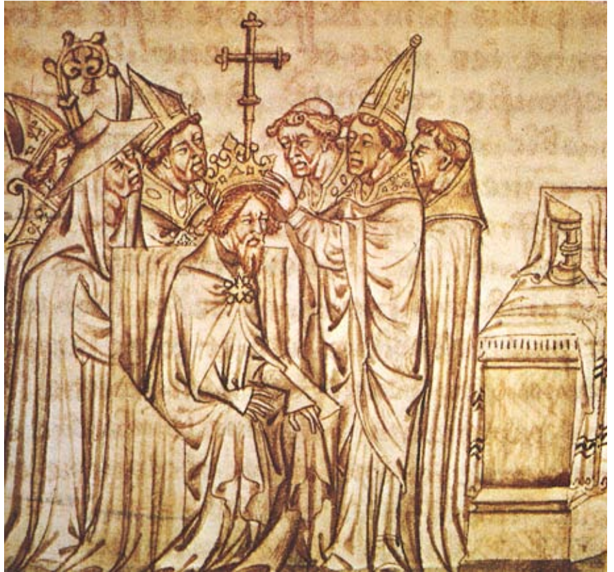
El dia de Nadal de l'any 800 el papa Lleó III va coronar Carlemany com a “Rex Imperator” de l’“Imperium Romanorum Occidentium”. Miniatura d'un manuscrit del segle XV.

Un d'aquests grups foren els francs. Des de principis del segle V iniciaren una lenta ocupació de les terres al sud i oest del seu territori original –el que avui és Westfàlia– sota el liderat de caps electes –que ja s'anomenaven reis– de diferents tribus com Meroveu i Xilderic. Un segle més tard, Clodoveu va ser el primer que va regnar en nom de tots els francs, entre 481 i 511. Però a la seva mort la corona es dividí un cop i un altre entre els fills i els néts. No va ser fins el 613 que novament un rei ho fou de tots els francs, Clotari