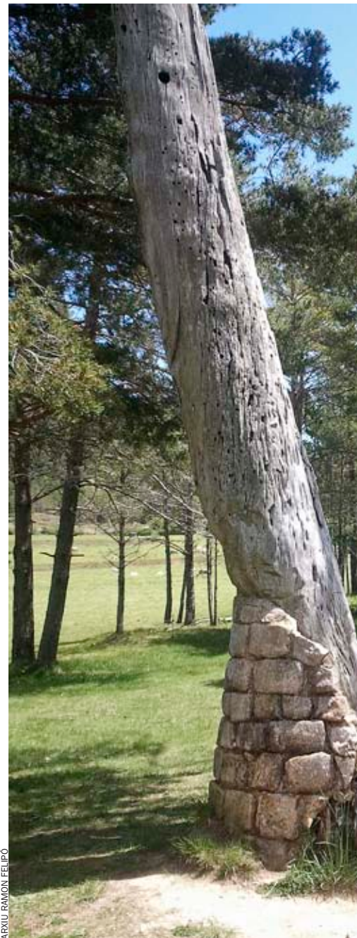
Imatge actual del Pi de les Tres Branques que deixa veure l'evident premeditació de la muti-

La popularitat del poema de Verdaguer de seguida va desplaçar l'al·legoria