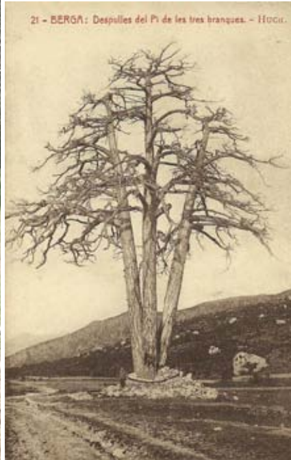
lació del 12 de maig passat. A la dreta, a dalt, portada de l'obra de Felipó amb la primera foto feta al Pi (de Jaume Monràs, el 1876) i una de posterior, presa a començament del segle XX.

reunir al voltant del Pi, l'any 1900. Ni tan sols el pretendent carlí, Carles VII, va donar suport a aquest últim aixecament de carlins del Berguedà encapçalats pel Nai de Vallcebre que no va reeixir. En el seu moment van recollir la notícia les revistes Nuevo Mundo , de Madrid, i la carlina La Hormiga de Oro , de Barcelona. I en totes dues el Pi va ser protagonista (vegeu-ne imatges a la pàg. 28).