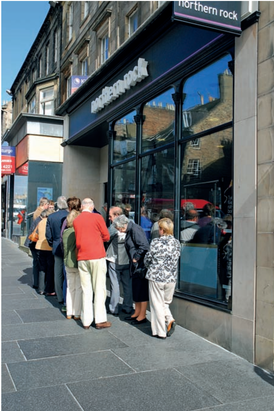
Dilluns passat, el govern britànic anunciava la nacionalització temporal del banc Northern Rock, la principal víctima de la crisi mundial causada per la caiguda de les hipoteques d'alt risc als EUA.

el Financial Times imprimí la notícia, però la gota del Financial sembla haver estat la que ha fet vessar el got de la banca espanyola. El dia 14 de febrer vingué la carta formal de l'Associació Espanyola de la Banca (AEB), les demandes de correcció, les puntualitzacions: les inversions creditícies dels bancs espanyols estan garantides amb dipòsits d'un 18% més que les britàniques, el finançament exterior no arriba ni al 20%, els diners del Banc Central Europeu s'obtenen gràcies a actius de