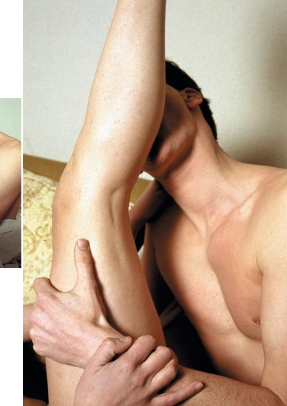
El sexe del segle XXI es fonamenta sobre l'estabilitat i la fidelitat de la parella, però això sí, demana moviment, innovació, i no diu que no a cap pràctica si està prèviament pactada.

en fase d'elaboració, és que moltes actituds sexuals que en públic es consideren estranyes o anormals, en privat resulten perfectament normals i acceptades. En la seua classificació sobre el comportament de les parelles (vegeu requadre), activitats com la fel·lació, el cunnilingus o la visió conjunta de material eròtic o pornogràfic resulten absolutament quotidianes i d'altres, com el coit anal o l'ús de joguines sexuals, molt més habituals del que es pot pensar en un primer moment.