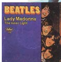
L'acostament dels Beatles a l'orientalisme data de mitjan anys seixanta, l'època en què van conèixer Joan Mascaró. Al

costat, caràtula del senzill on apareix la cançó The Inner Light .