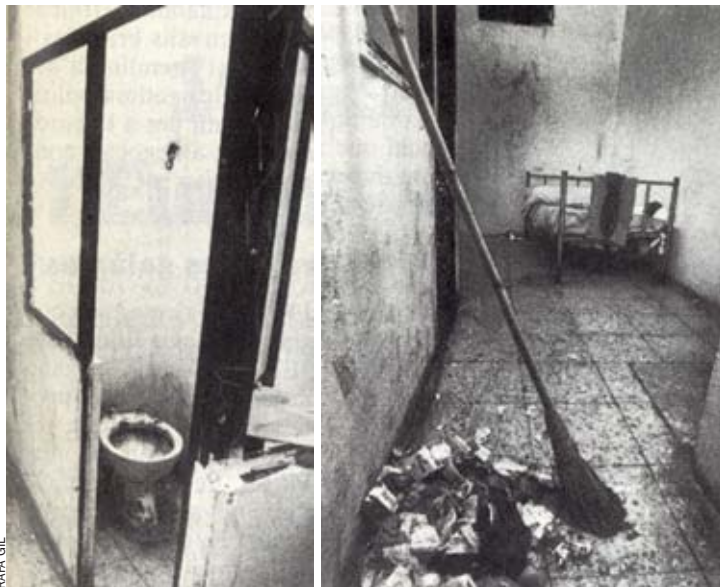
Diverses imatges amb l'aspecte de la cel·la d'aïllament i un wàter conegut com "el Tigre".