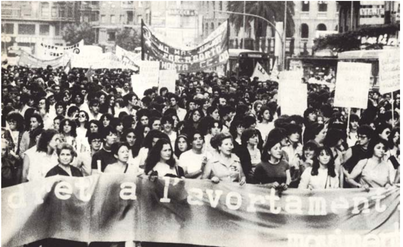
Manifestació en favor de l'avortament i del centre de planificació familiar.

un hospital, amb anestèsia i dignitat... i en secret. És tan bojament absurd que vulguen castigar-me per allò, que he perdut la confiança en la llei, en els metges, en els polítics... Què volien? Obligar-me a tenir un fill no desitjat? Que em morís en una carnisseria clandestina? Suppose que fer-ho en un hospital ja deu ser cru. Imagina't fer-ho allà, per més metges que fossen. No puc donar permís a ningú per a decidir què ha de fer amb el meu cos; és idiota tan sols pensar-ho".