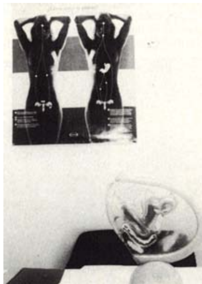
Les dones del 1986, obligades a avortar de manera clandestina.

A banda les adreces que qualsevol persona mínimament informada pot proporcionar, a la ciutat continuen treballant més de cinc i, potser, més de deu metges privats que no s'amaguen excessivament, i que practiquen avortaments bé per convicció personal bé per guanyar uns diners suplementaris. Tots aquests, que cobren una quantitat al voltant de les trenta mil pessetes, ho fan en acceptables condicions sanitàries –alguns fins i tot amb anestèsia– sem-