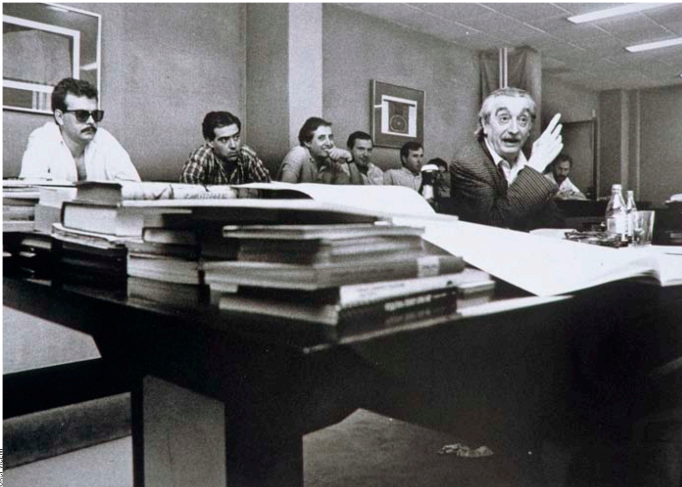
L'aspirant a professor de ple dret de la Universitat de València, Joan Fuster, fent la seua exposició.

Joan de la Creu Fuster i Ortells, 62 anys, de Sueca, l'intel·lectual valencià més decisiu del nostre temps, per poder ser professor de ple dret de la Universitat de València, va llegir el dia 17 de juliol el treball d'investigador, un altre, que va destil·lar els darrers nou mesos. Heus ací una possible crònica de la seua ascensió al Gòlgota universitari.