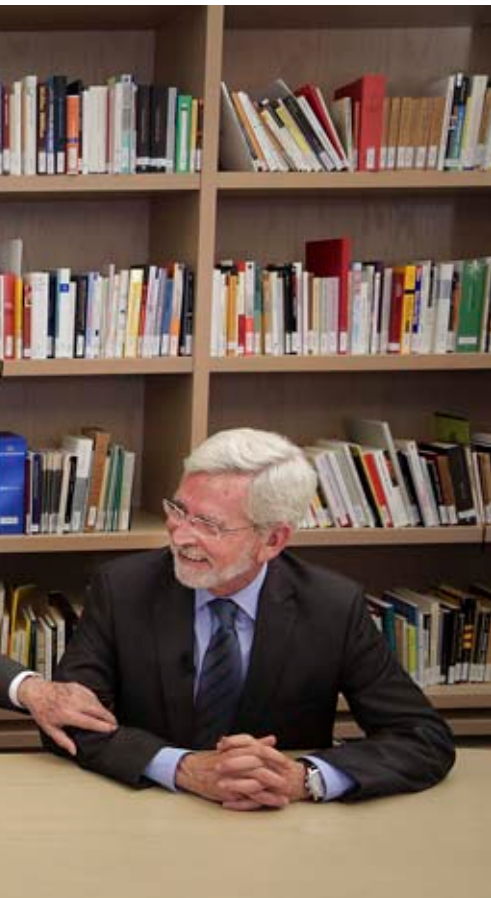
coincidir 12 anys com a presidents, aquesta ha estat la primera trobada trilateral.

mica així però va entendre'm, perquè és intel·ligent [riu].