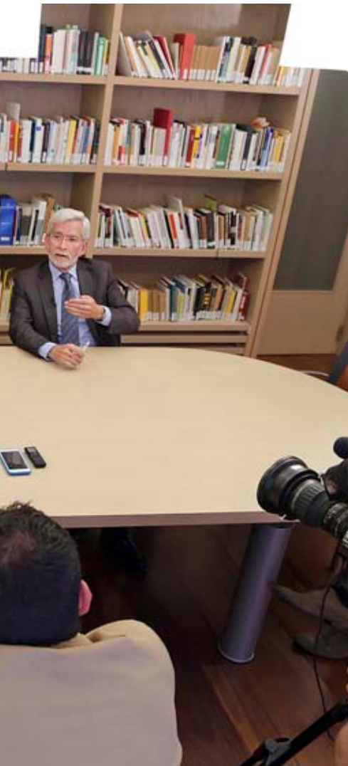
d'administració d'Edicions del País Valencià.