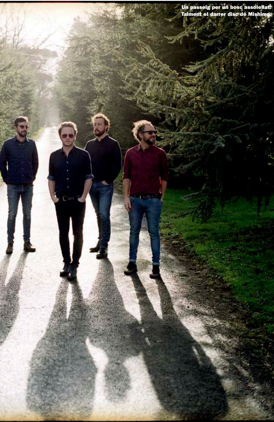
Un passeig per un bosc assòllat. Talment el darrer disc de Mishima

i un piano generant un so que no saps ben bé que és. Aquí hem jugat al contrari, un so molt nítid, molt clar, semblant als nostres directes. Buscàvem un estudi on es pogués gravar en directe.