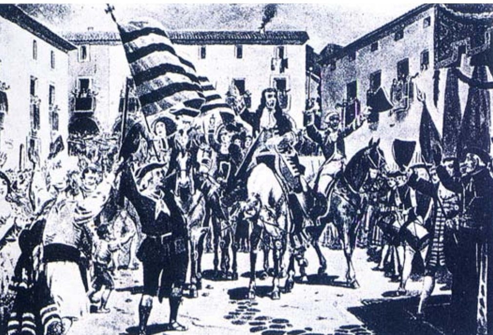
Proclamació a Dénia de l'arxiduc Carles d'Àustria com a rei de València per Joan Baptista Basset.