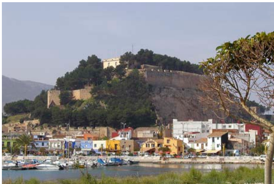
El port i el castell de Dénia, escenaris de la història de l'exili denier a les Illes. Baix, el record commemoratiu de la proclamació de Carles d'Àustria.