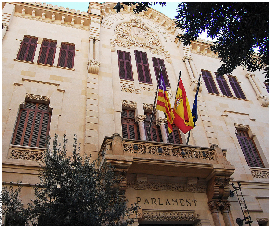
L'any que ve se celebren eleccions al Parlament balear i tot és obert, el canvi pot ser possible.

més dificultats per assolir el seu gran objectiu. En efecte, en aquella ocasió el PSM, Esquerra Unida, Els Verds i ERC sumaren les forces respectives creant la coalició Bloc, la qual va aconseguir 4 escons. Si no s'haguessin unit, 1 dels 4 diputats se l'hauria quedat el PP i hauria tingut majoria absoluta. Junts, l'evitaren. El 2011, tanmateix, el Bloc es va rompre. PSM va anar per una banda –en coalició amb IniciativaVerda, un nou partit format per Els Verds i escindits d'Esquerra Unida– per una banda i EU i ERC cada un per la seva. El resultat fou que la suma dels sufragis dels neocomunistes –quasi 10.000, pràcticament un 3%– i dels independentistes republicans –uns 5.000, 1,2%– arribaren a uns 15.000 que es perderien , que quedaren sense representació i que en cas d'haver anat a parar, com el 2007, a una mateixa candidatura, ben bé haurien significat restar un diputat al PP.