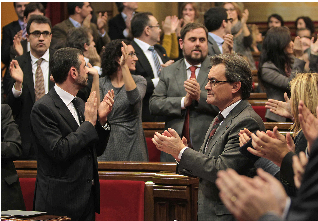
La declaració de sobirania del Parlament de Catalunya –a la foto, el moment posterior a l'aprovació– ha estat declarada inconstitucional pel TC.

El frontó judicial. L'aparell de l'Estat el formen els cossos d'alts funcionaris d'institucions públiques, com ministeris o ambaixades però també agències estatals presumptament independents i bona part de l'estructura del poder judicial amb el Tribunal Constitucional (TC) al punt més alt de la piràmide. Fa unes setmanes, el TC, que es pot considerar responsable de l'espurna que va fer encendre la ciutadania catalana –la retallada d'un Estatut de Catalunya aprovat per les Corts espanyoles i pel poble català en referèndum–, va declarar nul·la i inconstitucional la declaració de sobirania aprovada pel Parlament de Catalunya el gener de 2013. Aquesta declaració era un pas lògic perquè Catalunya, com a sub-