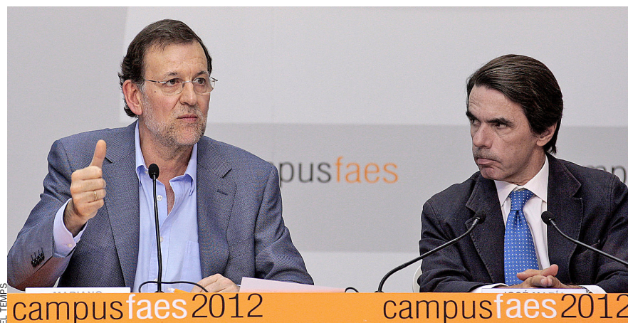
Mariano Rajoy i José María Aznar en un acte de la Fundació Faes, think tank del PP que ha editat un opuscle amb vint arguments de resposta al sobirisme.

E l Ministeri d'Afers Estrangers i Cooperació distribueix entre les seves ambaixades i consolats un document perquè el cos diplomàtic escapci qualsevol dubte sobre la possibilitat d'una Catalunya sobirana; el Tribunal Constitucional declara nul·la la declaració de sobirania del Parlament; la FAES, el think tank del PP, elabora un argumentari contra les raons dels que defensen el dret a decidir; l'anomenada Brunete mediàtica apunta contra l'Assemblea Nacional de Catalunya i la qualifica de "colpista" i el CNI –el servei d'intel·ligència espanyol– ja fa un any que va reforçar la seva presència a Catalunya –i no per la possible existència de gihadistes en terres catalanes.