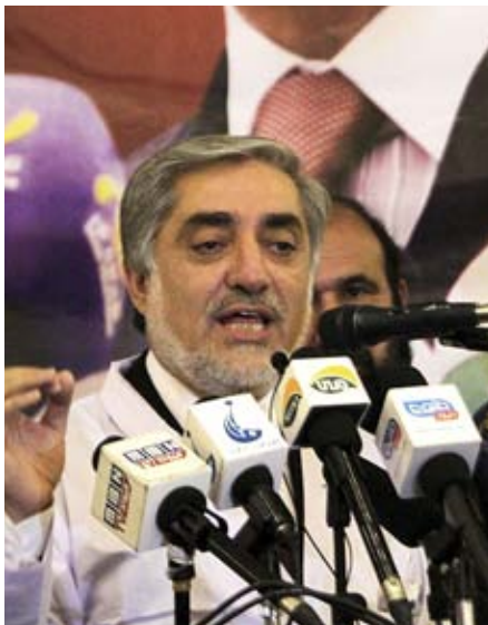
Més candidats a la presidència: el paixtu Ashraf Ghani, un tecnòcrata educat als Estats Units, i Abdullah Abdullah, que representa sobretot la majoritària força tadjik.

saber abraçar fins l'enemic i, si és possible, amb més amabilitat encara.