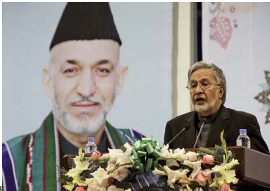
El candidat presidencial i ex-ministre afganès d'Afers Estrangers Zalmay Rassoul durant un miting electoral a Kabul.

Els darrers 12 anys han transcorregut per a Karzai a l'ombra del president, fent de conseller de Seguretat i ministre d'Afers Estrangers. Gairebé feia l'efec-