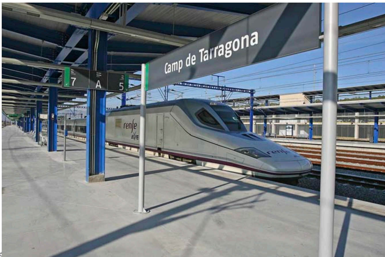
L'estació Camp de Tarragona és a 20 minuts en cotxe de Reus i Tarragona, un fet que feia minvar les potencialitats de l'alta velocitat al Tarragonès.

de la Generalitat. En aquest sentit, durant aquest mes de març es posarà en servei el bus exprés entre el Vendrell i Tarragona. En una segona fase es millorarà el servei Tarragona-Reus i ja en una tercera es desenvoluparan els serveis exprés Tarragona-Salou-Cambrils, Tarragona-Valls, Salou-Reus i Tarragona-Vila-seca.