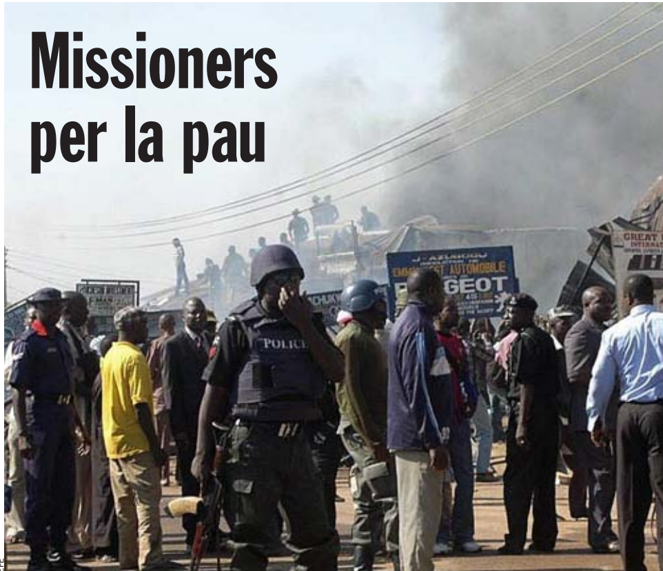
Polícies i curiosos després d'un atemptat a la ciutat de Kaduna.

Des d'aquest centre posen en marxa sistemes preventius d'alarma en zones en crisi, organitzen seminaris per a polítics