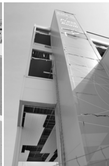
Imatges de l'abandó que presenta el circuit urbà de València, on ja fa dos anys que no se celebra cap cursa.