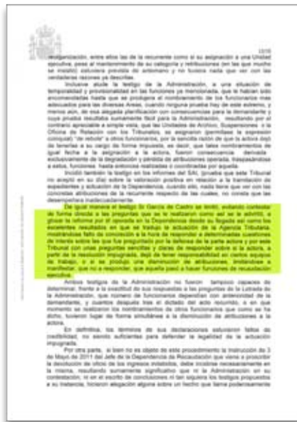
Una sentència del TSJC condemna l'AEAT per haver destituït del càrrec una funcionària que va denunciar irregularitats, i dicta "desviació de poder" del màxim responsable d'Hisenda a Catalunya.