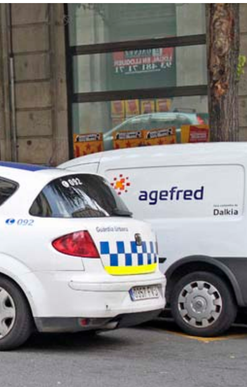
sius que llança l'AEAT per cobrar la multa.

i honesta, no té per què desconfiar-ne”, rebla aquest funcionari.