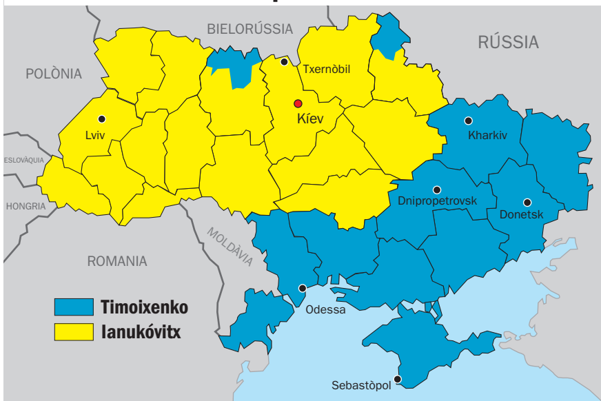
Mapes de la divisió política ucraïnesa entre est i oest.

invertit a Ucraïna contrasta amb els oferiments de la Unió, que no han passat de l'acord d'associació esmentat, que no era d'integració –com volien els polítics locals europeïstes– sinó de mera col·laboració. Una relació massa prima i fèble per als ucraïnesos que miren amb interès cap a Europa però que estan molt lluny de París o Berlín i massa a prop dels poderosos interessos soviètics a la zona.