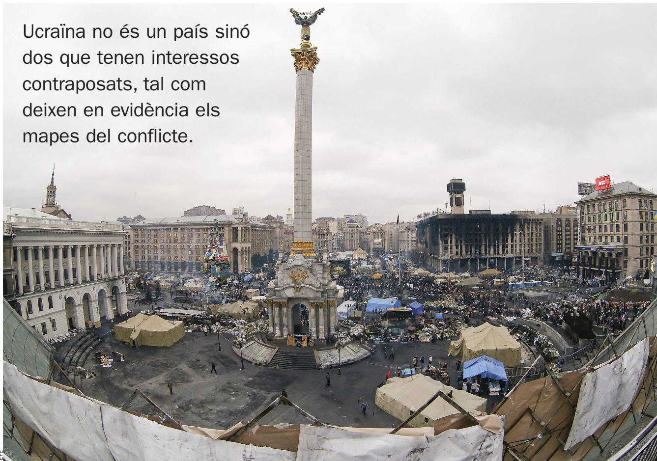
Plaça de la Independència de Kíev. El polvorí que és Ucraïna podria esclatar amb conseqüències globals difícils d'imaginar.

Ucraïna no és un país sinó dos que tenen interessos contraposats, tal com deixen en evidència els mapes del conflicte.