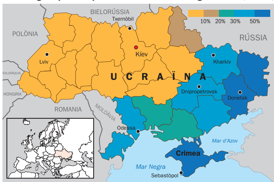
Mapa etnolingüístic d'Ucraïna