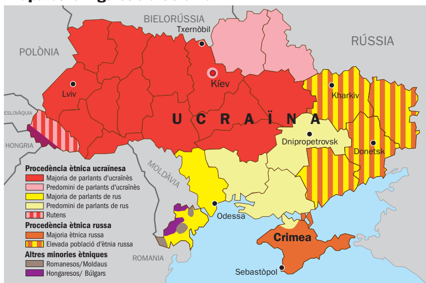
Mapes d'Ucraïna que presenten la divisió per ètnies, cultures i llengües del país.

eleccions, per suposades irregularitats, i el pro europeista assolí el poder. És fàcil entendre la polèmica que seguí com a conseqüència d'aquell resultat. Els pro russos entengueren que se'ls havia robat la victòria. Els altres, que s'havia rectificat el furt que hauria estat donar per bo el primer escrutini.