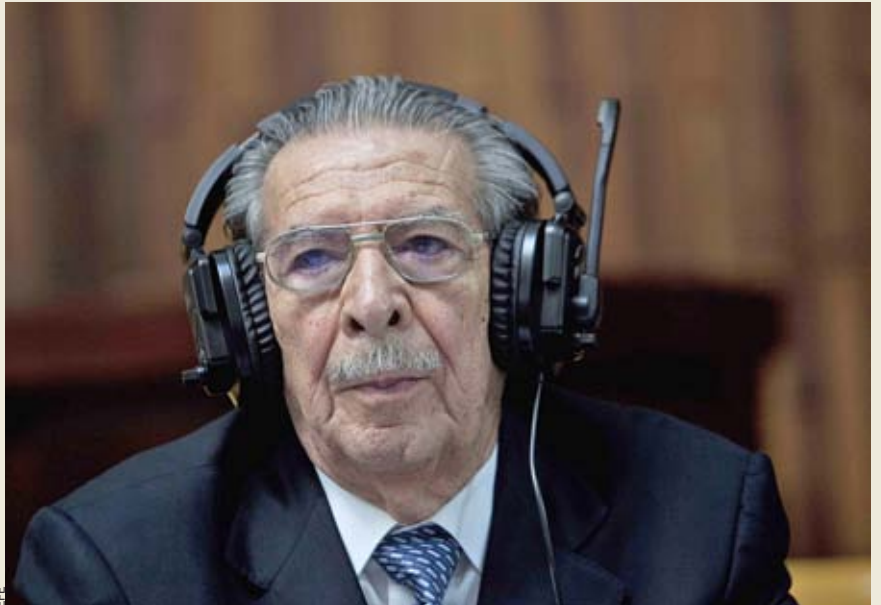
Ríos Montt durant el judici que el va condemnar per genocidi a Guatemala.

El procés per arribar fins ací ha estat, però, no poc tortuós. Es va iniciar l'any 1999, quan l'activista pels drets humans Rigoberta Menchú va presentar una denúncia en l'Audiència