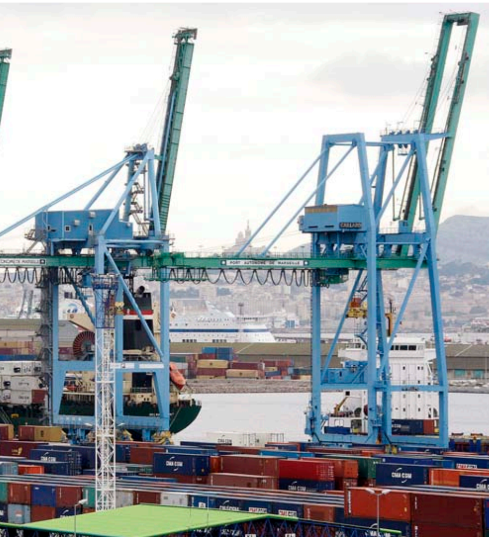
lars d'aquesta ciutat, entorn del qual gira gran part de l'activitat econòmica.

lloc, l'impacte de la P3, l'aliança que aglutina les tres empreses navilieres líders en el transport marítim mundial: la danesa Maersk, la suïssa Mediterranean Shipping Company (MSC) i CMA CGM. En segon lloc, tot el que