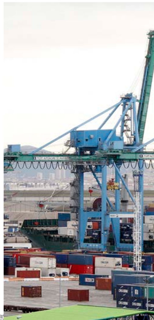
El port de Marsella és una de les pedres angu-

Precisament de Marsella és l'empresa CMA CGM, la tercera empresa naviliera més important del món pel que fa al transport marítim de contenidors. Una companyia, amb seu a la ciutat francesa i 650 oficines repartides per tot el món, que té presència a 150 països,