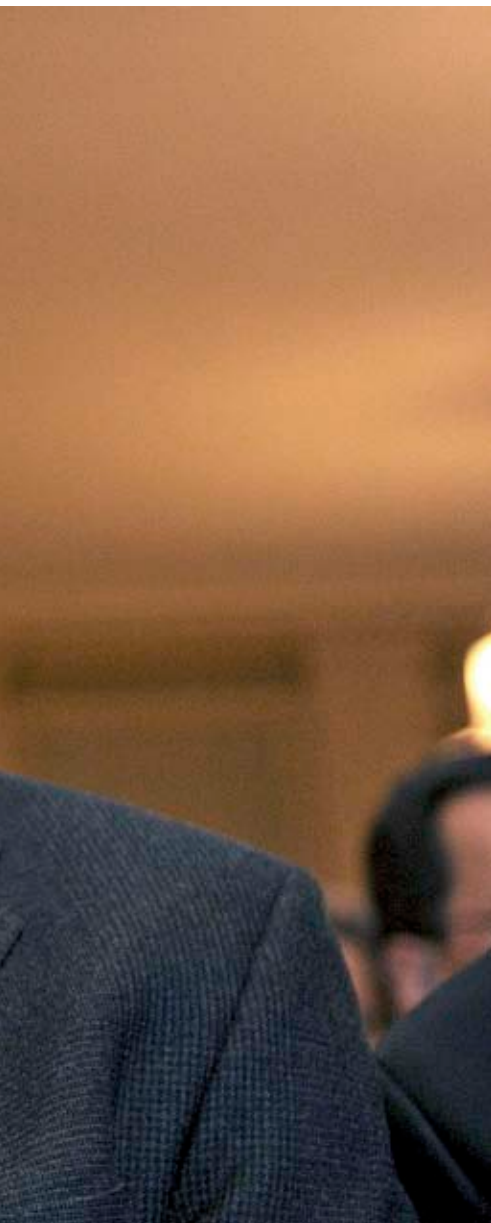
l'esdeveniment més complex de la història.

això, molts desitjaven pertànyer al regne serbi. En el vostre darrer llibre no mostreu comprensió pel desig polític de l'autor de l'atemptat. Per què?