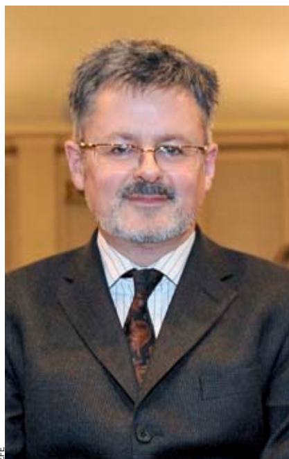
“Totes les grans potències europees van provocar la guerra.”

—La complexitat de l'ultimàtum de juliol no pot servir d'excusa, ja que els que prenen les decisions ho feien lliurement. No obstant això, a Europa no hi havia cap polític que estigués disposat de debò a evitar la guerra. Això no exculpa els alemanys que en aquell