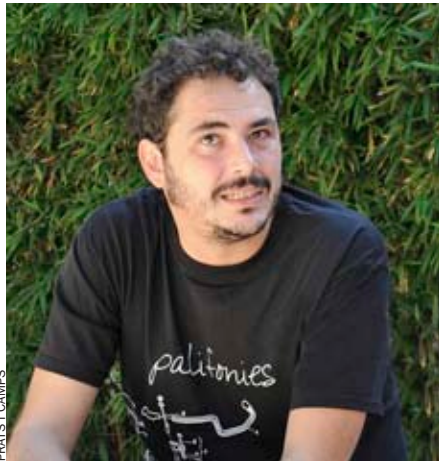
PRATS I CAMPS