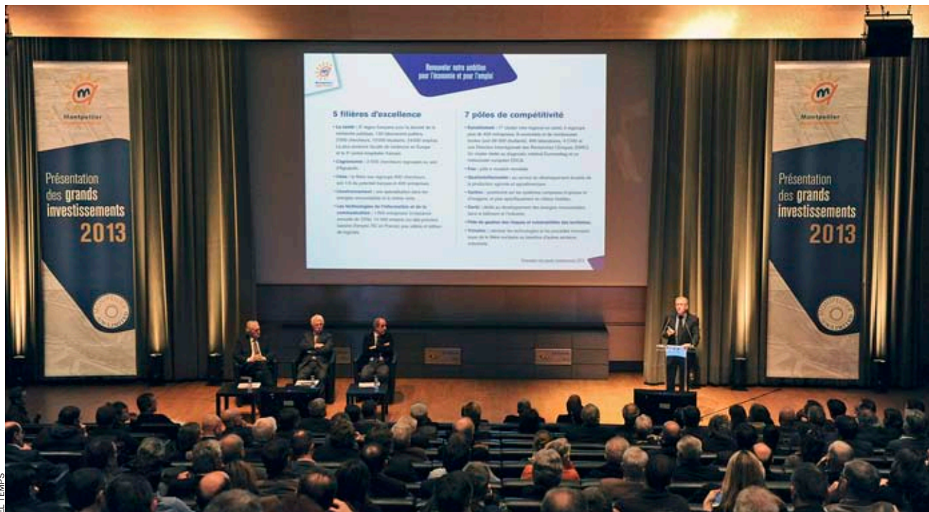
L'Aglomeració de Montpellier ha detectat fins a set pols de competitivitat que fan més atractiu aquest territori a ulls dels inversors internacionals.

d'Europa. I finalment, un sector pel qual també competeixen altres regions i països –Andorra és la principal candidata a atraure empreses pels avantatges fiscals i el fet de tenir tot el país amb fibra òptica–, les TIC. Montpellier concentra un miler d'empreses tecnològiques, amb un creixement anual del 7,5%, amb 10.000 llocs de treball centrats sobretot en la creació de videojocs i aplicacions mòbils. Una àrea de negoci que a Catalunya ja està molt desenvolupada i amb possibilitats d'expansió internacional.