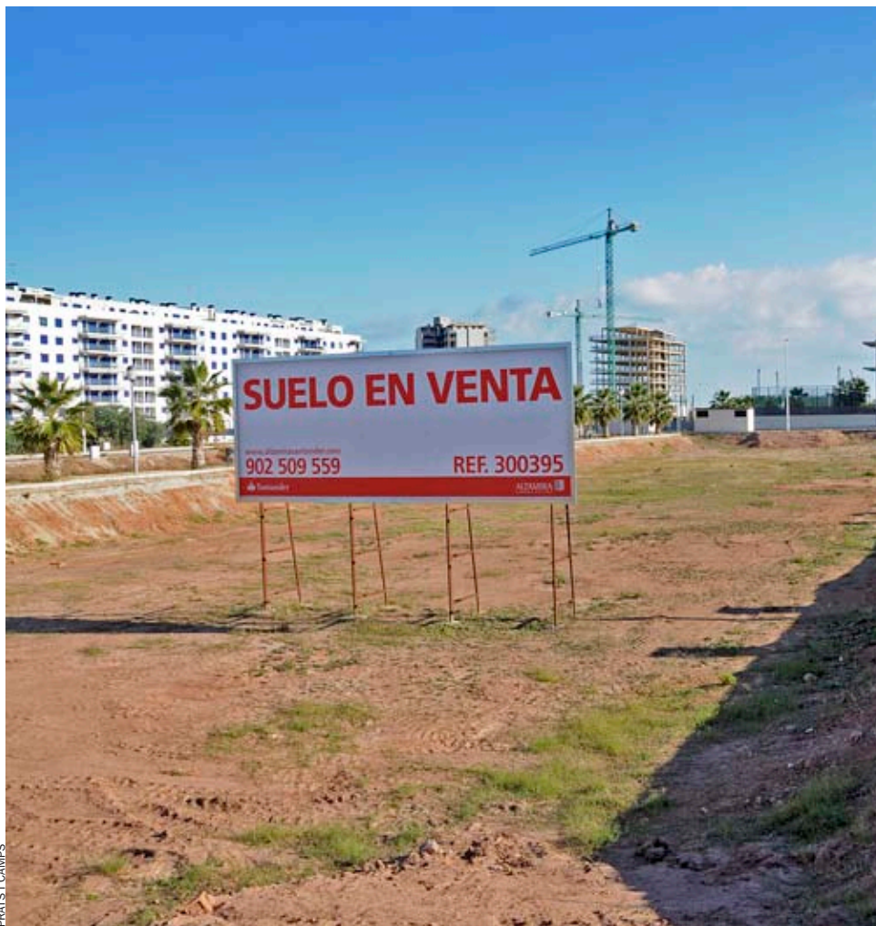
L'especulació urbanística ha deixat aquest rastre a Moncofa.

A pocs mesos que les dessaladores comencen a fer brollar l'aigua, la inquietud he emergit entre els alcaldes dels municipis afectats. Perquè tan bon punt circule per les canonades, els ajuntaments que van signar convenis i els usuaris hauran de començar a pagar les quotes per amortitzar la part que els cor-