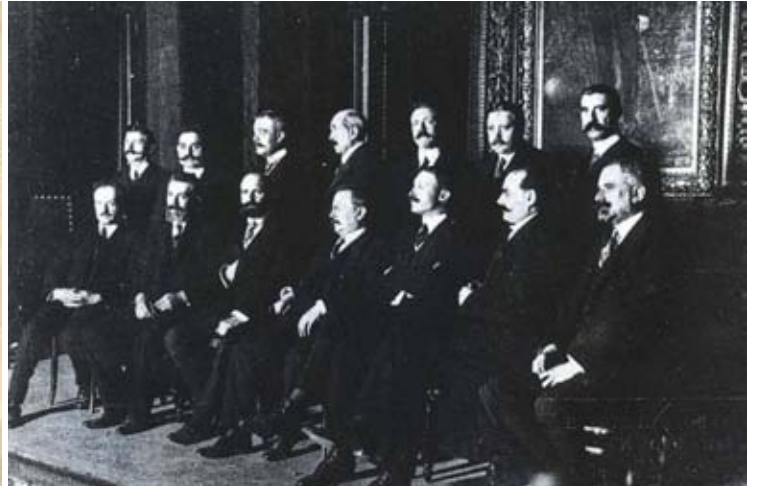
A l'esquerra, els presidents de les Diputacions. A la dreta, el Consell de la Mancomunitat i a sota, la nova xarxa telefònica que va impulsar.