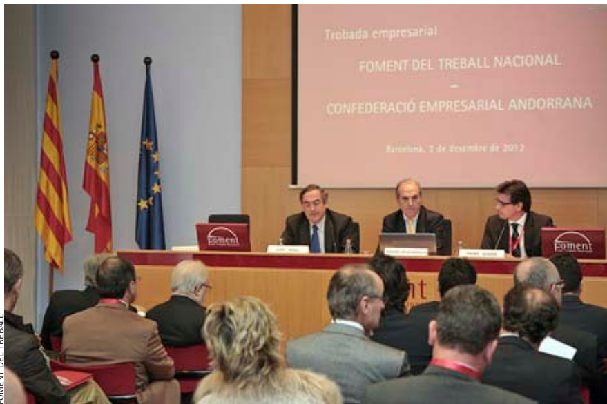
La Confederació Empresarial Andorrana (CEA) explica el nou model econòmic i fiscal a inversors de diferents països. A la imatge, una reunió amb empresaris catalans a Foment del Treball.