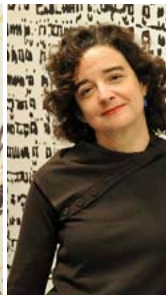
PRATS I CAMPS