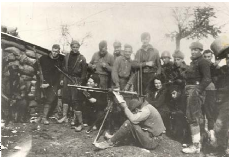
George Orwell. A sota, amb Eileen O'Shaughnessy i membres de l'ILP al front d'Aragó, en el setge d'Osca, el 13 de març de 1937.