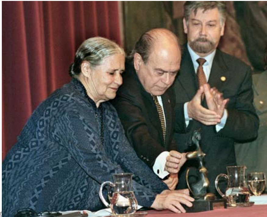
El 1997 la recentment desapareguda Doris Lessing rebia el Premi Internacional Catalunya de mans del president Jordi Pujol i el president de l'Institut Català de la Mediterrània, Baltasar Porcel.

de Madrid i enrolar-se en les Brigades Internacionals. Amb aquesta voluntat tornava a Barcelona, a passar uns dies de permís el 26 d'abril de 1937 –després d'haver-se estat 115 dies seguits al front– si de cop no s'hagués produït un fenomen que va modificar de soca-rel la seva percepció sobre la Guerra Civil i les diferents estratègies polítiques existents a la rereguarda. D'entrada el va sorprendre el canvi que en quatre mesos s'havia operat pels carrers de Barcelona, on “l'atmosfera revolucionària s'havia esvaït”, la ciutat “tornava a ser una ciutat normal, una mica encongida i atrotinada per la guerra, però sense cap senyal exterior de predomini obrer”, i on “la normal divisió de la societat en rics i pobres, classe alta i classe baixa, s'estava tornant a establir”. Aquesta era la situació que va trobar en retornar del front, una setmana abans que les contradiccions que des de l'inici de la guerra s'estaven generant dins del front antifeixista català esclatessin en forma de lluita de barricades pels carrers de Barcelona.