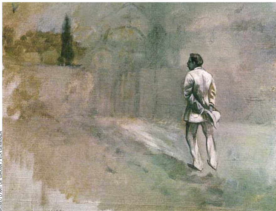
MUSEU D'ART DE GIRONA / ELA GEMINADA