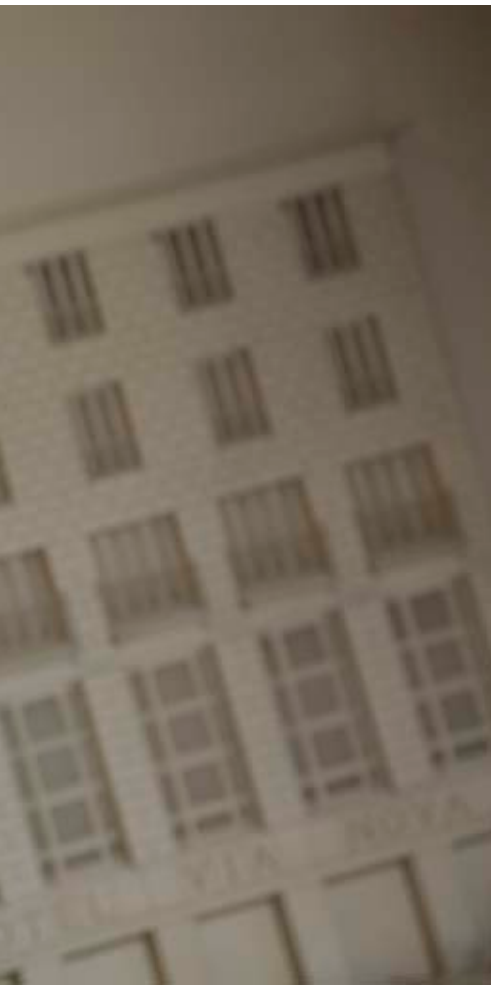
plaça Reial de Barcelona.

jo em vaig moure en un ambient de coneixement, discussió, estudi i lectures d'història de la meua ciutat. Per tant, cultura, podríem dir, del darrer tram del Noucentisme, amb una dedicació extrema per la història de Catalunya i de Barcelona.