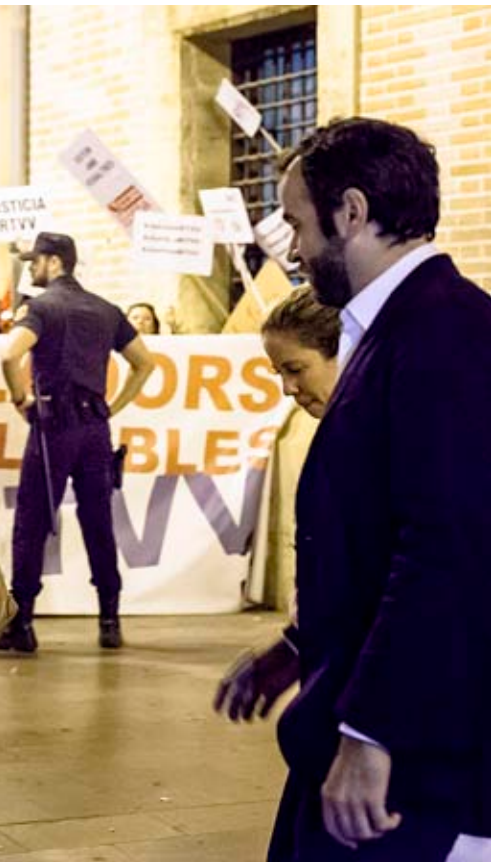
judici per l'ERO.

entre els treballadors de dins i els de fora quan només falten unes setmanes per a conèixer la sentència del judici.