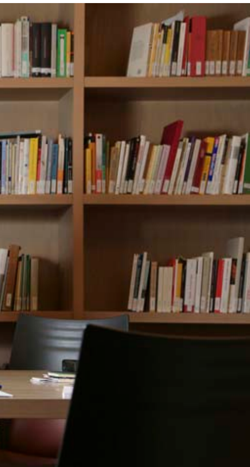
iniciatives culturals i polítiques.