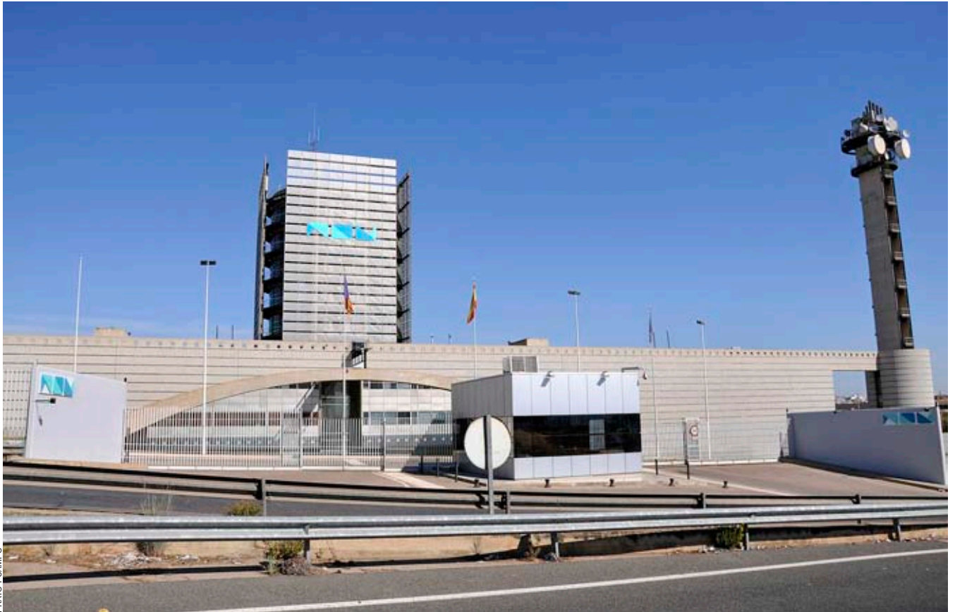
Canvi radical: a l'emblemàtic edifici de Burjassot el 9 ha estat substituït per NOU, i el color roig ha virat en blau.

El 21 d'octubre es veurà al TSJ de València el judici per l'ERO a Canal 9. Els prop de mil treballadors despatxats esperen la nul·litat per injust i per arbitrari. La Generalitat en defensa la pulcritud mentre la nova direcció treballa a escarada per esborrar qualsevol rastre de l'antiga Radiotelevisió Valenciana.