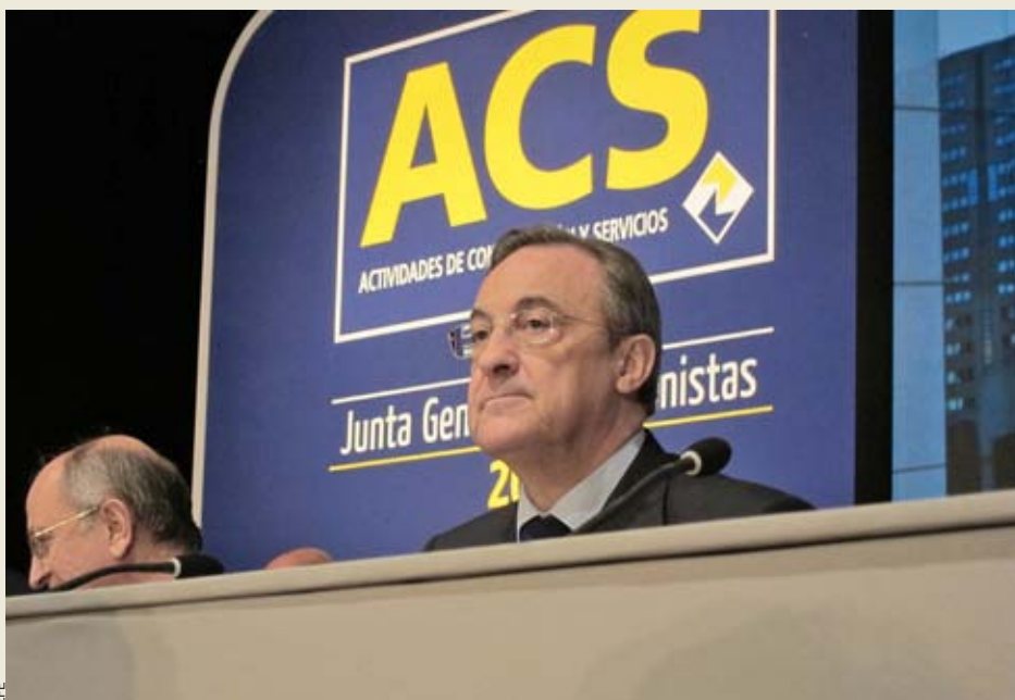
Florentino Pérez, president del Reial Madrid, posseeix el 12,5% de les accions d'Actividades de Construcción y Servicios, SA.

El cost del projecte és molt elevat. A 31 de desembre de 2011 ja s'hi havia gastat 1.193,5 milions d'euros, una desviació a l'alça del 90% sobre el cost inicialment previst. L'empresa concessionària va aconseguir els diners d'un crèdit sindicat per 19 bancs –espanyols i francesos, entre