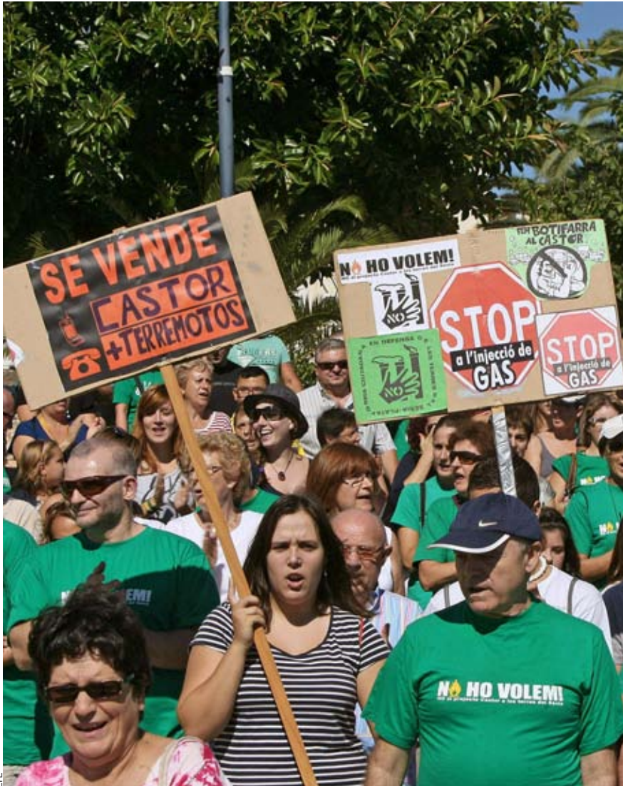
Manifestació celebrada el passat dia 6 pels veïns d'Alcanar (Montsià) contra el magatzem Castor.

Els terratrèmols provocats per Castor han sacsejat les consciències dels qui viuen al nord del País Valencià i el sud del Principat. Acostumats a ser “la perifèria de la perifèria”, alcen la veu per reclamar el desmantellament immediat del magatzem i ser tractats com ciutadans de primera.