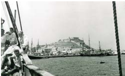
ARXIU JOHN CABRERA