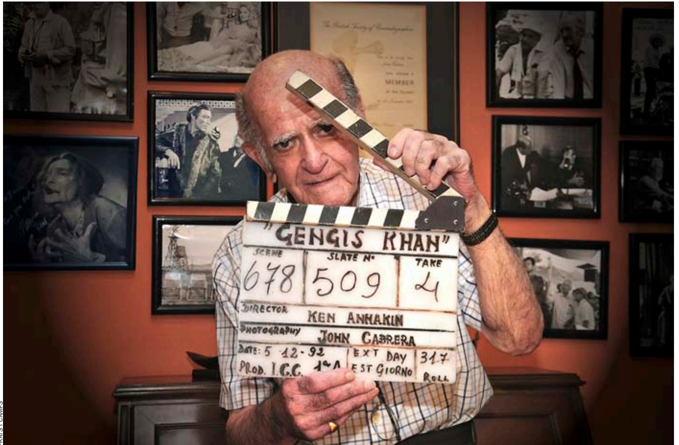
FRATIS I CAMPS