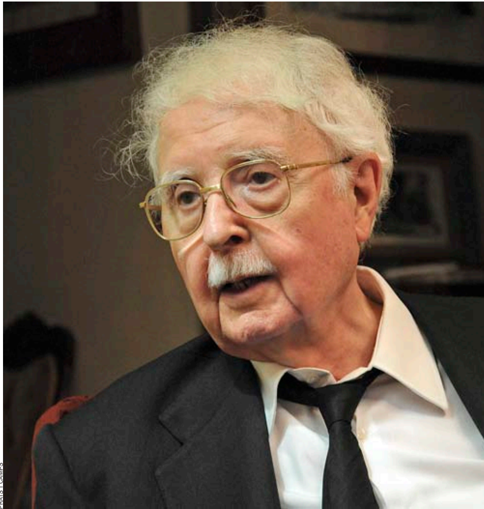
FRATS I CAMPS

—Al Museu Sant Pius V. A banda dels meus, molts dels quadres que s'hi exposen són propietat de la Reial Acadèmia de Sant Carles, i molts altres són de l'estat, perquè procedeixen de la desamortització, com també l'edifici. L'única condició que vaig posar a la Generalitat és que els meus quadres no isqueren del museu, tret que canvie de lloc. Darrera-