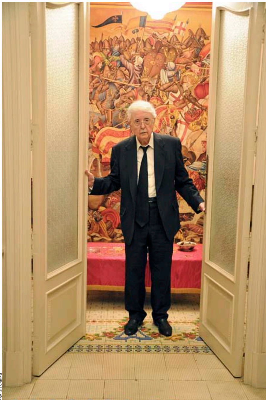
FRATIS I CAMPS

tant pel matrimoni homosexual com per a molestar qui governa, i ací va passar igual, però quan el Tribunal Constitucional va donar-hi el vist-i-plau, tothom va callar de seguida, fins i tot qui hi havia recorregut en contra. Amb el catalanisme vam viure una cosa pareguda, per bé que amb una raó de fons més llarga.